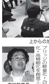
上からの加圧で強度を図る

創意工夫しブリッジ作製。地盤工学会の11チームで、軽量化、強度競う。地盤工学会の11チームで、軽量化、強度競う。