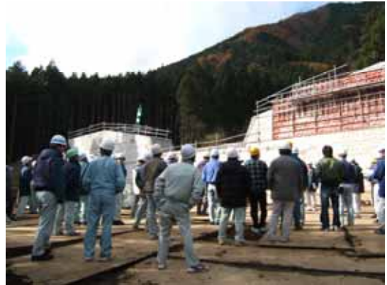
現場見学会の様子

全体の参加者は89名であり、寒い中ではありましたが、熱心に関係者の説明を聞いたり現場を観察したりと、大変有意義な1日となりました。当日は、工事発注者である国土交通省関東地方整備局日光砂防事務所において担当職員の方から工事概要の説明を聞いた後、参加者が多かったことから、2台のマイクロバスに分乗し2班に分かれて、大谷川の支川である稲荷川上流における山腹工事と野上沢における堆積土砂の流出を防ぐための砂防堰堤工事の2箇所を見学させて頂きました。